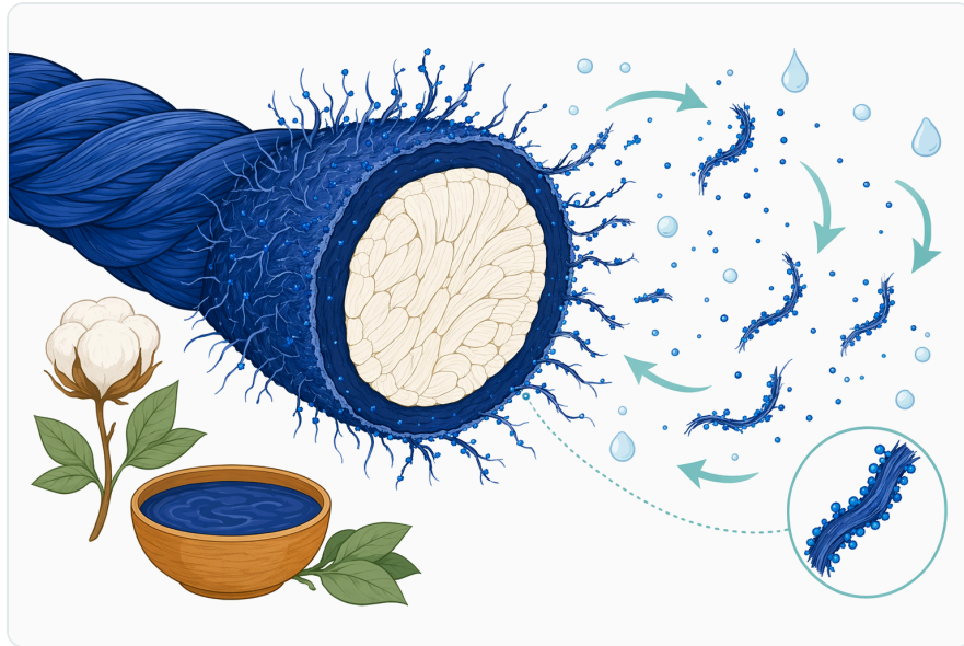
Figure 1. 효소 데님 워싱에서 인디고 색이 떨어지는 것은 주로 표면에서 일어나는 현상이다. 눈에 보이는 파란색의 상당 부분이 실의 바깥쪽에 집중되어 있기 때문이다.

Questa azione è diversa da una degradazione profonda del tessuto. Nel denim washing, il risultato desiderato è una modifica localizzata della superficie, non la perdita indiscriminata di resistenza o massa del capo. La letteratura sulle applicazioni tessili degli enzimi sottolinea infatti che la selettività enzimatica è utile proprio quando il processo è condotto in modo da limitare effetti collaterali sulle proprietà meccaniche [1] .