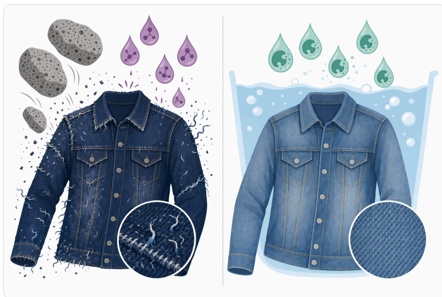
Figure 3. 셀룰라아제 기반의 페이딩은 염료가 묻어 있는 면 표면 물질을 제거하는 방식인 반면, 라카아제 유형의 탈색은 반응하기 쉬운 염료 발색단의 산화적 변화를 통해 작용한다.

Il quarto beneficio è ambientale potenziale, non automatico. Se l'enzima consente di ridurre abrasione severa, cicli ripetuti, eccesso di chimica o consumo idrico, può contribuire a un processo più sostenibile. Tuttavia, il carico complessivo va valutato sull'intera linea: acqua, energia, prodotti ausiliari, refluo, risciacqui e qualità del capo finito. Le review sui reflui tessili ricordano che i coloranti e i contaminanti associati al settore richiedono comunque strategie di gestione e trattamento adeguate [9].