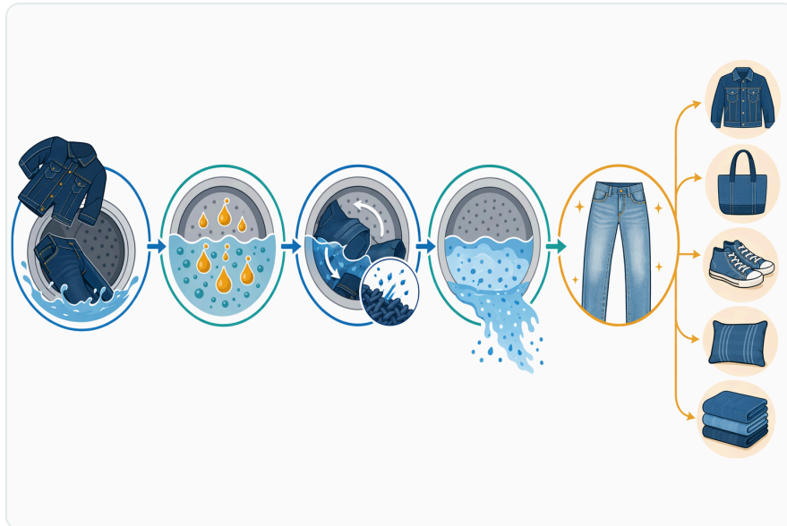
Figure 4. 탈락한 인디고 입자가 충분히 분산된 상태로 유지되어 행굼으로 제거되지 않으면, 더 밝은 데님 부위에 다시 달라붙어 백스테이닝이 발생한다.

I coloranti tessili sono una classe importante di contaminanti industriali perché possono persistere negli effluenti e influenzare penetrazione della luce, fotosintesi acquatica e qualità delle acque riceventi. Le review sulla bioremediation dei reflui tessili riportano l'interesse verso microrganismi ed enzimi per degradare o trasformare coloranti, ma sottolineano anche la complessità della matrice effluente industriale [4].