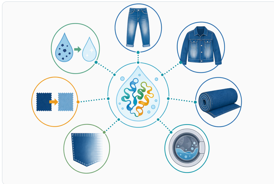
Figure 5. 인디고 탈색 효소 기술은 의류 워시다운, 스톤-효소 효과, 바이오폴리싱, 복합 효소 연구, 그리고 인디고 함유 폐수 처리 개념에 활용될 수 있다.

Dal punto di vista applicativo, la responsabilità dell'utilizzatore include la compatibilità con tessuti, ausiliari, macchinari, scarichi e requisiti del marchio finale. Un effetto visivo accettabile in un programma moda può non essere adatto a un altro, e un processo sostenibile deve essere misurato sull'intero ciclo di produzione. Le review sulla biocatalisi industriale evidenziano che l'integrazione sostenibile degli enzimi richiede progettazione di processo, non semplice sostituzione di un reagente con un biocatalizzatore [10] .