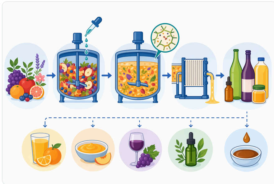
Figure 7. 펙티나아제는 일반적으로 습윤 또는 마쇄 후, 압착·원심분리·여과·정제·농축·건조 전에 적용된다

تزداد أهمية هذه النقطة في المنتجات الطبيعية التي تُستخدم بدائل للإضافات الاصطناعية أو مصادر لمضادات أكسدة نباتية. فالمراجعات الحديثة عن مضادات الأكسدة النباتية في الزيوت الصالحة للأكل توضح أن الفائدة الصناعية للمركبات الطبيعية لا تعتمد على وجودها فقط، بل على استقرارها، وتوافقها مع المصفوفة، وطريقة الحصول عليها ومعالجتها [16]. لذلك يكون البكتيناز جزءًا من منظومة جودة تشمل المادة الخام، الاستخلاص، الفصل، والتخزين.