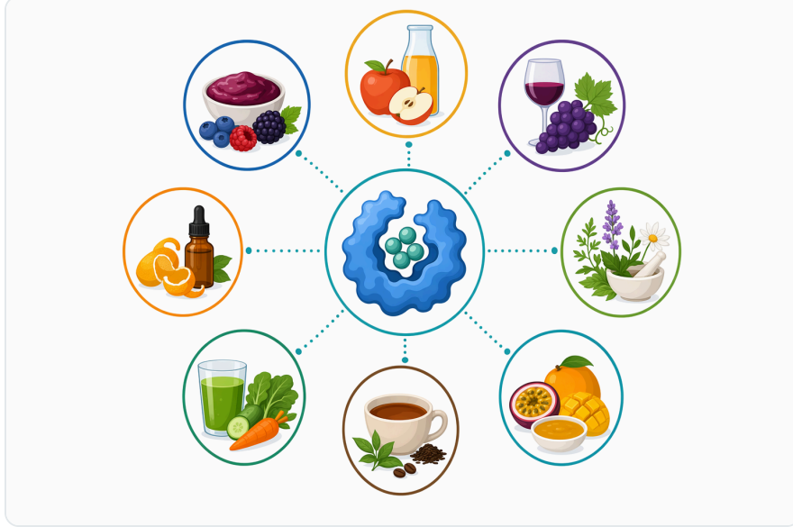
Figure 6. 발표된 효소 보조 추출 연구는 껍질, 박, 잎, 꽃, 위과 등 다양한 식물 성 기질을 다룬다

يُدمج البكتيناز عادة في مرحلة يكون فيها البكتين متاحًا للإنزيم: بعد التقطيع أو الطحن، ومع وجود رطوبة أو وسط سائل يسمح بانتشار الإنزيم داخل المصفوفة. زيادة مساحة السطح تساعد على التلامس، لكن الطحن المفرط قد يرفع كمية الجسيمات الدقيقة ويزيد صعوبة الفصل لاحقًا. لذلك يجب موازنة التفتيت الميكانيكي مع الهدف النهائي من الترشيح أو الضغط أو الصفاء.