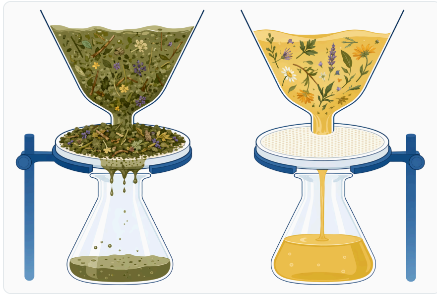
Figure 4. 펙티나아제는 펙틴 사슬을 짧게 만들어 펙틴이 풍부한 식물성 액체의 청징을 개선하고 여과 저항을 줄일 수 있다