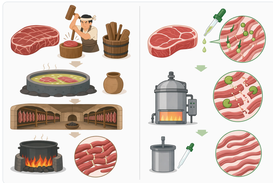
Figure 6. 브로멜라인, 파파인, 피신은 모두 식물성 단백질분해효소이지만, 식물학적 원료, 소비자 인지도, 용도별 특성에서 차이가 있습니다.

Für B2B-Kommunikation sind daher Formulierungen wie „unterstützt Proteinhydrolyse“, „kann proteinbedingte Trübungen reduzieren“, „ermöglicht kontrollierte Texturmodifikation“ oder „eignet sich für proteolytische Prozessschritte“ präziser als absolute Versprechen. Sie beschreiben, was Bromelain tatsächlich leistet, ohne eine identische Wirkung in jeder Matrix zu behaupten.