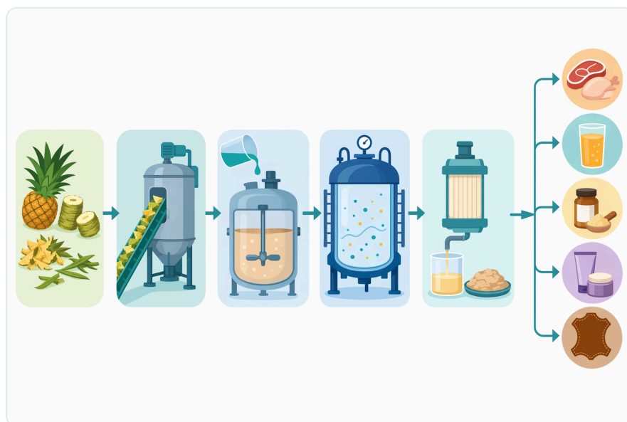
Figure 4. 육류 가공에서 브로멜라인을 이용한 연화는 효소와 근육 단백질 사이의 제어된 접촉과, 과도한 가수분해로 물러지는 것을 막는 공정 한계 설정에 달려 있습니다.

Diese Einordnung ist für ein technisches B2B-Dokument nur als Abgrenzung relevant. Ein zugelassenes oder registriertes Verbraucherprodukt hat eigene Spezifikation, Darreichungsform, Dosierung, Indikation, Packungsbeilage und regulatorische Bewertung. Daraus folgt nicht, dass ein industrielles Enzymprodukt mit denselben Aussagen beworben, formuliert oder eingesetzt werden darf.