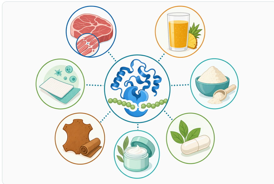
Figure 3. 동일한 단백질 절단 활성은 육류 연화, 단백질 가수분해물, 소화효소 보충제, 화장품 각질 제거, 특수한 국소 단백질 제거 연구에 활용됩니다.

Für Aromavorstufen und herzhafte Geschmacksprofile kann kontrollierte Proteolyse nützlich sein, weil Peptide und freie Aminogruppen in weiteren Verarbeitungsschritten Reaktionen eingehen können. Trotzdem ist Bromelain hier kein universeller Geschmacksverstärker. Der Prozess muss so geführt werden, dass der gewünschte Peptidbereich entsteht und unerwünschte Bitterkeit begrenzt bleibt.