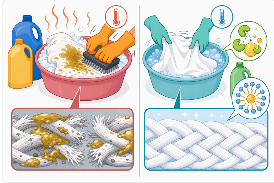
Figure 4. 세제 효소는 종류에 따라 서로 다른 얼룩 화학 성분을 표적으로 하며, 리파아제는 단백질, 전분, 셀룰로오스 관련 오염 또는 만난이 아니라 지방과 기름에 초점을 맞춥니다.