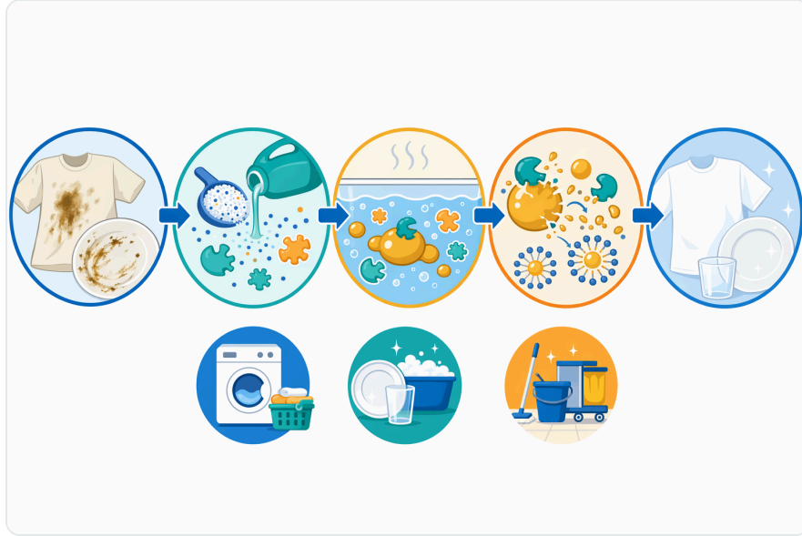
Figure 2. Alp01은 계면활성제, 빌더, pH 조절, 안정제, 세탁 작용이 함께 필요한 완전한 세제 시스템에서 리파아제 성분으로 작용합니다.

Sebum ve vücut yağı gibi kirler özellikle yaka, manşet, spor kıyafetleri, yatak tekstilleri ve otel çamaşırlarında birikir. Bu kirler yalnızca yağdan oluşmaz; protein, tuz, hücresel kalıntı ve çevresel partiküllerle karışık olabilir, bu nedenle lipaz çoğu zaman çok bileşenli bir deterjan sisteminin yağ fraksiyonunu hedefleyen parçası olarak düşünölmelidir [9] .