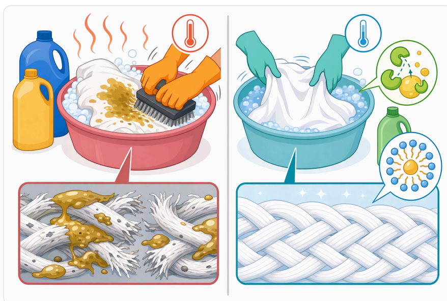
Figure 4. 각기 다른 세제 효소는 서로 다른 얼룩 화학 성분을 표적으로 하며, 리파아제는 단백질, 전분, 셀룰로오스 관련 효과 또는 만난이 아니라 지방과 기름에 초점을 둡니다.

leur comportement en présence de systèmes formulaires représentatifs, car une enzyme active sur substrat modèle peut se montrer moins performante dans un détergent réel [2].