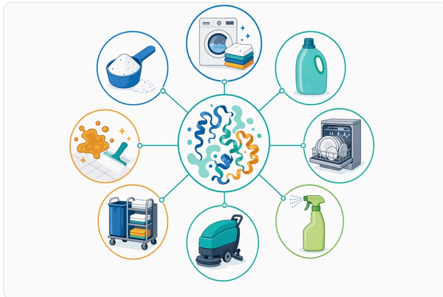
Figure 5. Alp01은 세탁 세제, 농축형 제품, 상업용 세탁, 섬유 전처리, 하드 서피스 클리너에서 지질 얼룩 제어 용도로 활용됩니다.