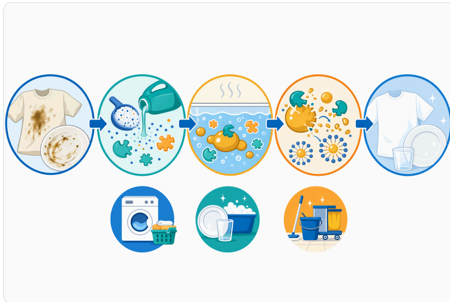
Figure 2. Alp01은 계면활성제, 빌더, pH 조절, 안정제, 세탁 작용도 함께 필요한 완전한 세제 시스템에서 리파아제 성분으로 작용합니다.